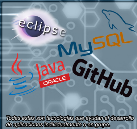
Todas estas son tecnologías que ayudan al desarrollo de aplicaciones individualmente o en grupo.