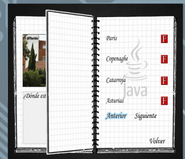
Esta aplicacion cuenta con varios extras que hacen que su uso sea mas animado y divertido, tales como, la iluminacion de los botones y su sonido y la animacion a la hora de cambiar de ventana.