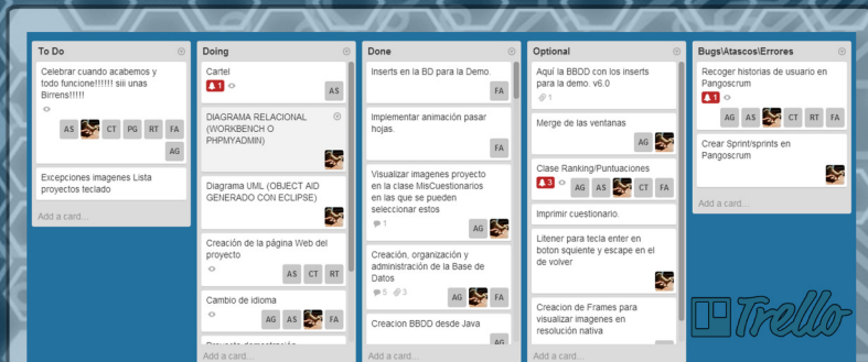
Trello es una tecnología web que nos facilita el trabajo en grupo gracias a la metodología Kanban y, la cual, se realiza facilmente con esta herramienta.

Creatutest has been developed to be used in helping people who need this type of service at any time. With its easy interface and its refined code based on Java, is the best choice when you want to create tests. The project has gone through different phases and many of them have made changes in the mechanism of the application to improve in several main aspects. The application has suffered several variants of the code, which has caused improvements in performance of it. Each of the group members took care to seek information about something specific to speed up the development process and avoid future problems.